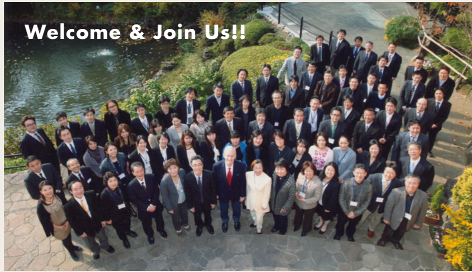
アレキサンダー研究会